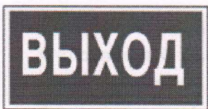
- указатель выхода