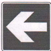
- направляющая стрелка к эвакуационному выходу