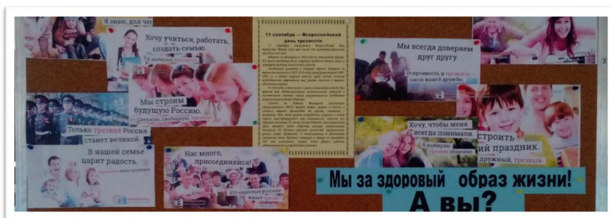
Агитационные плакаты Всероссийского социального проекта «Трезвый город»

6. К 10 апреля Кашкина Т.Г., учитель начальных классов, оформила информационный стенд «Трезвость – естественное состояние человека, семьи и общества» на основе агитационных материалов Всероссийского социального проекта «Трезвый город».