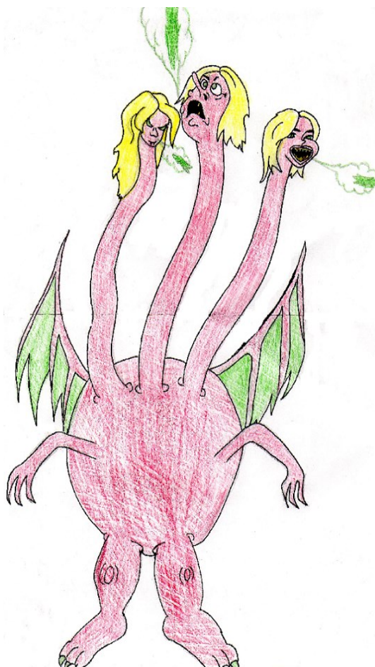
Художник Кириллов М.