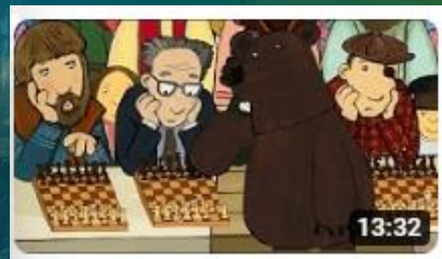
Мультфильм «Учёный медведь»