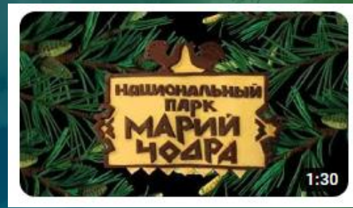
Мультфильм «Мы живем в России - Мари Эл (Видеоэнциклопедия нашей страны)»