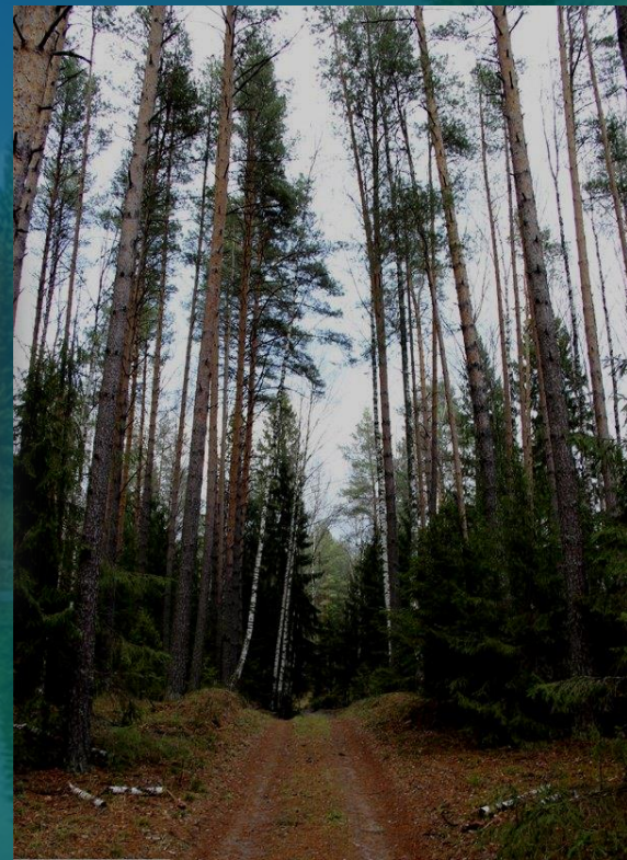
Старый казанский тракт