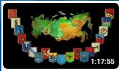
Сборник мультфильмов «СБОРНИК ИСТОРИЧЕСКИХ МУЛЬТОВ. Гора Самоцветов»

В 10 утра за детьми приезжает автобус и довозит их до места ожидания экскурсии. Во время поездки детям будут представлены следующие образовательные мультфильмы: «Мы живём в России – Марий Эл», «Учёный медведь» и сборник исторических мультфильмов для детей от студии «Пилот»