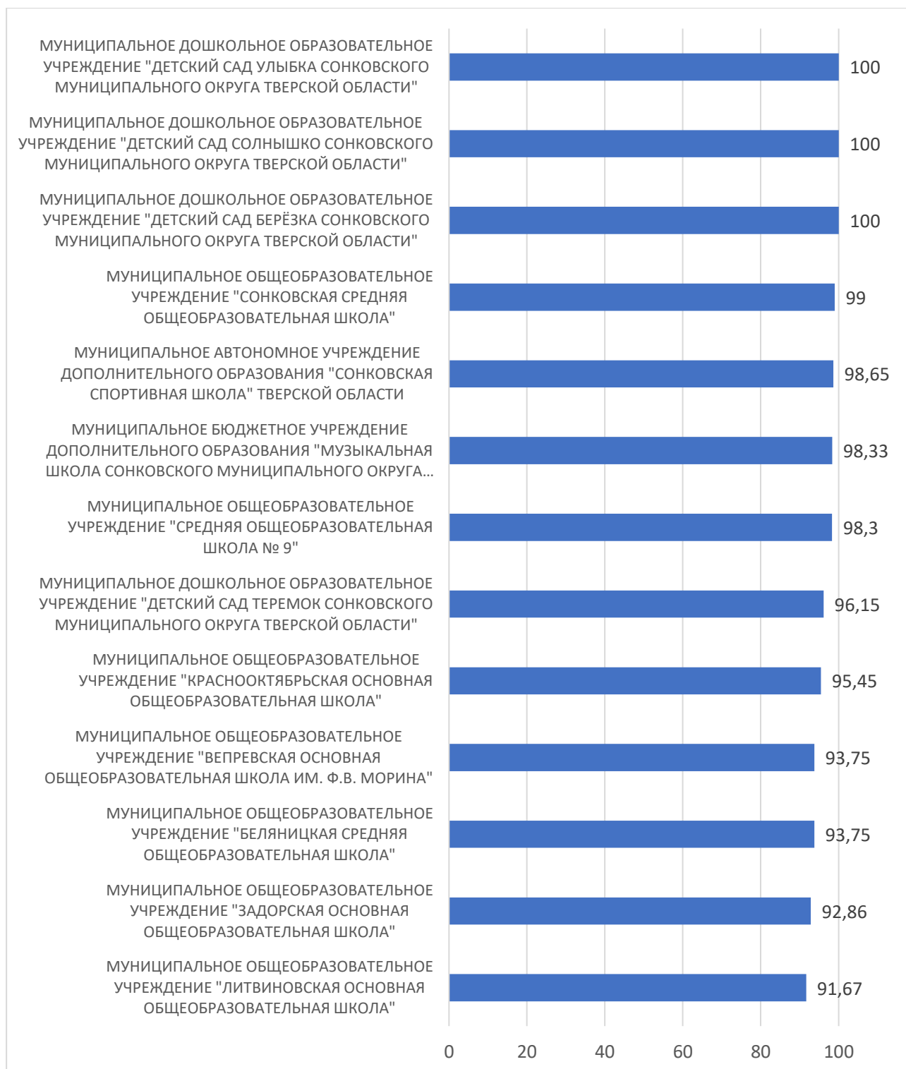
Рисунок 2 – Рейтинг организаций по критерию «Комфортность условий, в которых осуществляется образовательная деятельность»