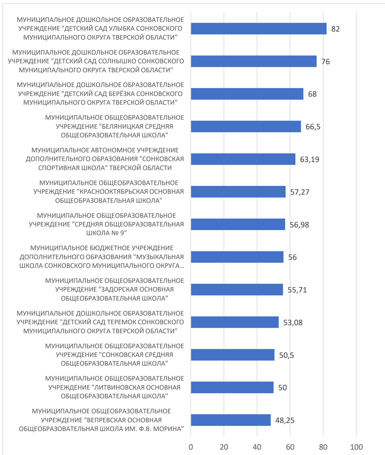
Рисунок 3 – Рейтинг организаций по критерию «Доступность образовательной деятельности для инвалидов»