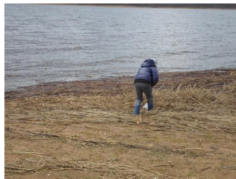
экологическое воспитание (оз. Щучье)