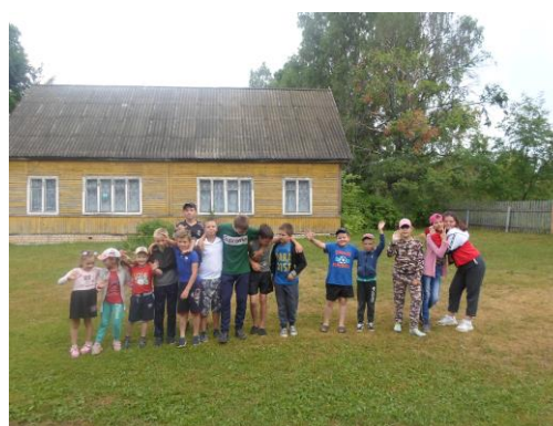
Жить здорово! (ЛОЛ)