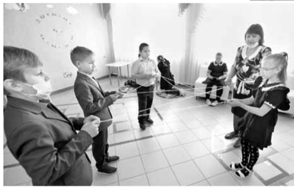
Четвероклассники играют в «Паутинку добра»