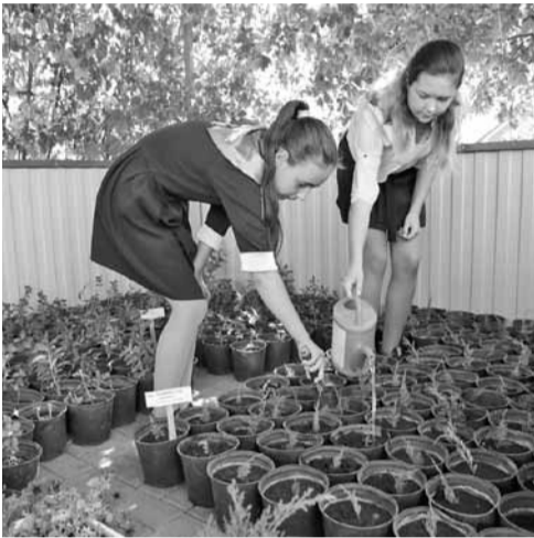
В школе выращивают растения с закрытой корневой системой