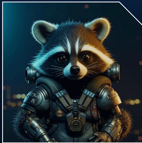
Ошибочный перевод от незнакомца