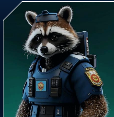
Стань внештатным сотрудником полиции