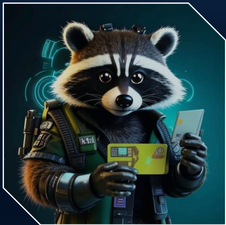
Несложная подработка «нужна только карта»