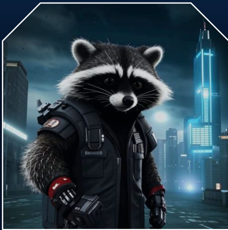
Помощник в обходе санкций