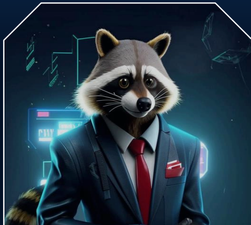
Помощь менеджеру банка