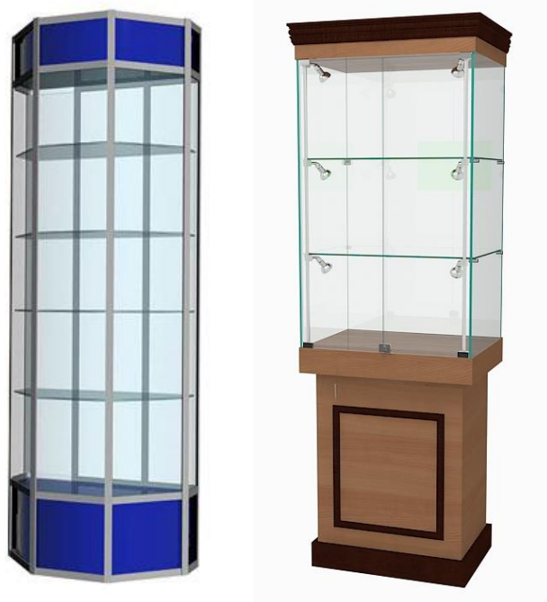
Примерный вариант: Витрина экспозиционная

Рис. 1. Модуль С «Разработка экскурсионных программ обслуживания / экскурсий», Модуль D «Проведение экскурсий»