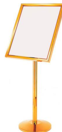
Примерный вариант: Стенд экспозиционный