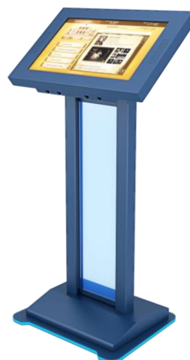
Примерный вариант: Интерактивный сенсорный стол/киоск