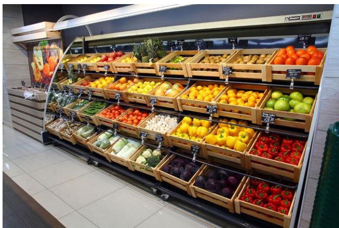
Рисунок 1.1 – Выкладка товаров в магазине

На все иллюстрации должны быть даны ссылки по тексту.