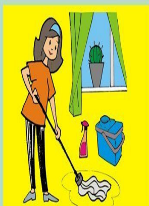
Ежедневно проводите влажную уборку