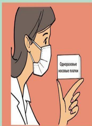
Используйте маски и одноразовые носовые платки