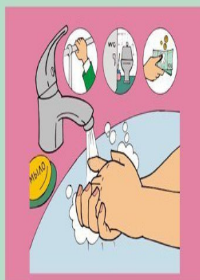
Регулярно мойте руки