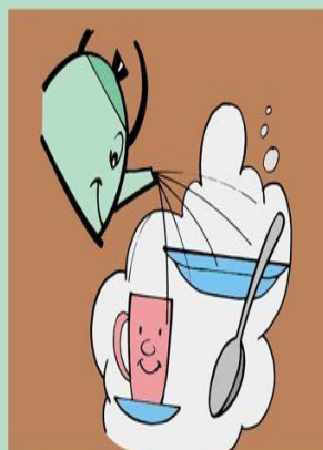
Выделите посуду больному