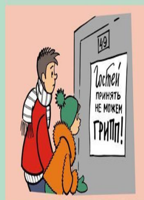
Ограничьте посещения массовых мероприятий