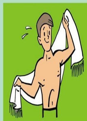
Закаляйтесь! Предупреждайте заболевания!