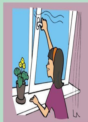
Часто проветривайте комнату