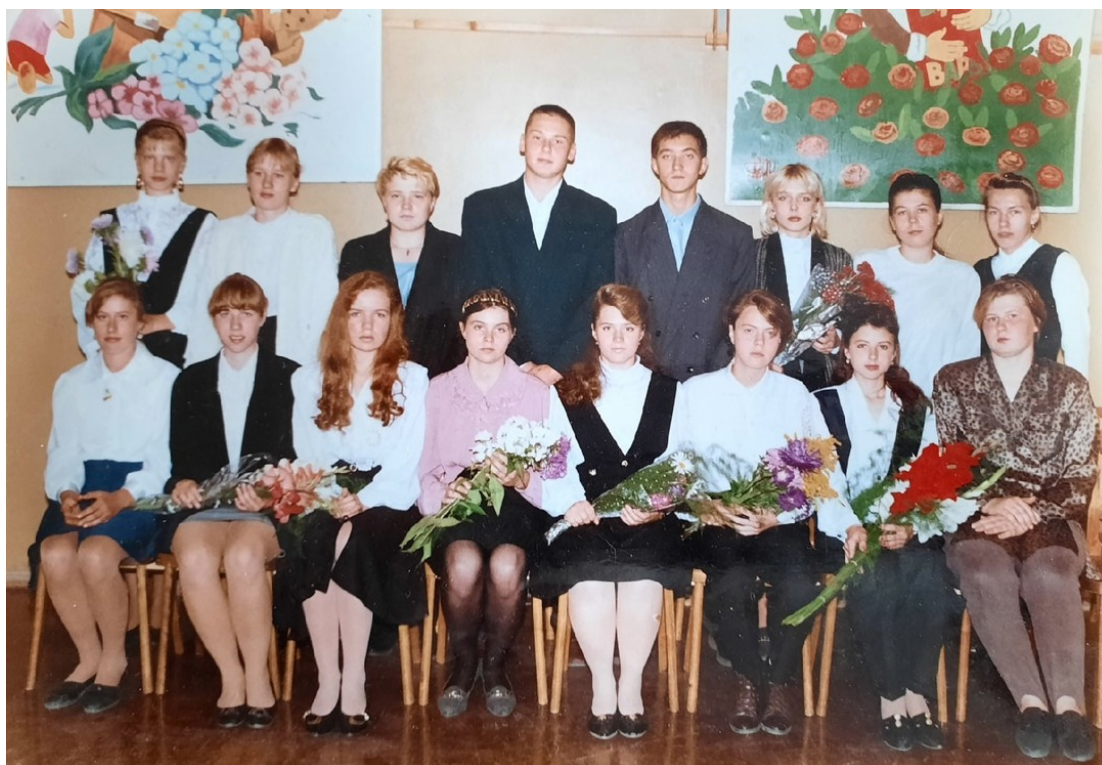
Выпускники 11-х классов 1996года

Всё, чего мы смогли добиться в своей жизни- всё это благодаря тому, что наши учителя были с нами все годы школьной жизни. Благодаря Вам мы стали теми, кем являемся! Спасибо Вам за всё!