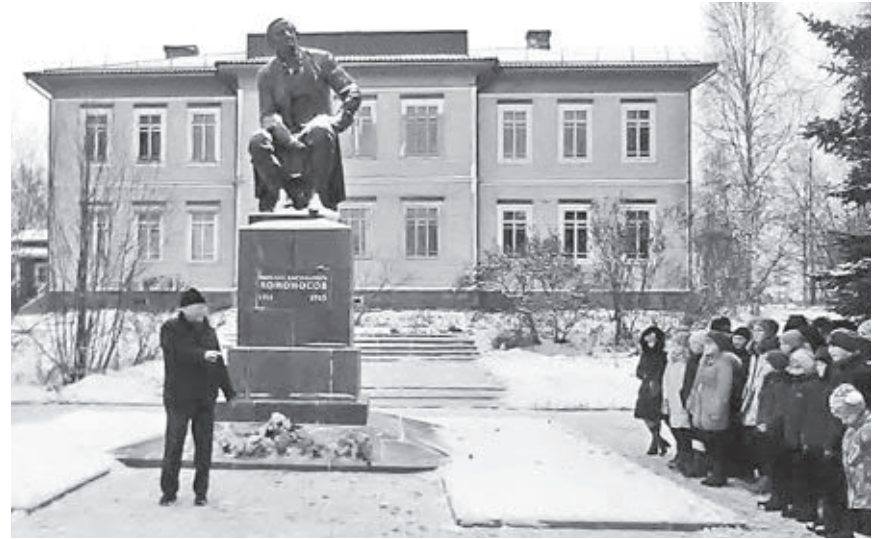
Памятник Ломоносову в его родном селе

В декабре 1957 года Архангельскому государственному педагогическому институту было присвоено имя М. В. Ломоносова. И это притом, что в стране уже существовало высшее учебное заведение, носящее его имя. Понадобилось специальное постановление Совета министров и согласие МГУ. Другим знаковым событием, предшествовавшим Ломоносовским чтениям, стало открытие 3 августа 1958 года в селе Ломоносове памятника великому ученому. Так шла подготовка к 250-летию со дня рождения Михаила Васильевича, которое широко отмечалось в