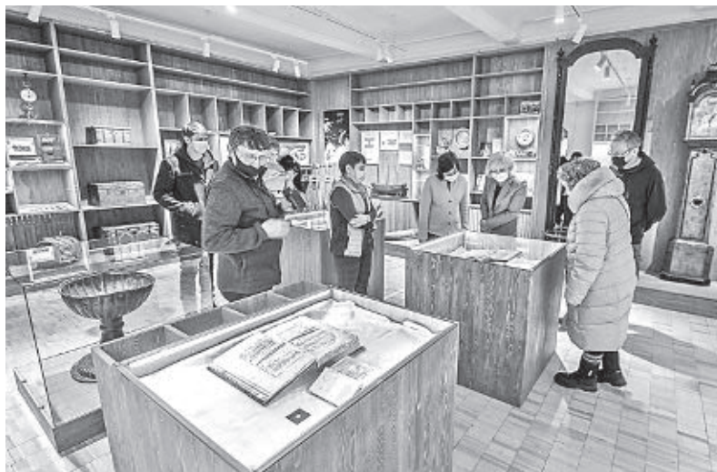
Музей ученого в селе Ломоносове

На малой родине первого русского академика сохранилось всего два здания, существовавших при жизни Ломоносова. Это церковь Святого Дмитрия Солунского, в строительстве которой в 1725–1738 годах приняла участие семья Ломоносовых, и Спасо-Преображенский собор в