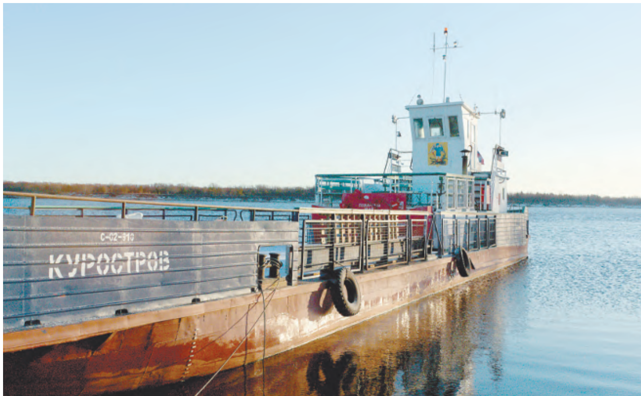
Ломоносово – село на острове Куростров. Чтобы добраться туда, необходимо на пароме преодолеть Северную Двину.

Отдельного внимания, пожалуй, заслуживает новая инфографика, разработанная в рамках обновления экспозиции. Это и карта освоения Русского Севера, и биография Ломоносова в карточках по годам его жизни, которые можно снимать для внимательного изучения. Это еще одно новшество всей экс-