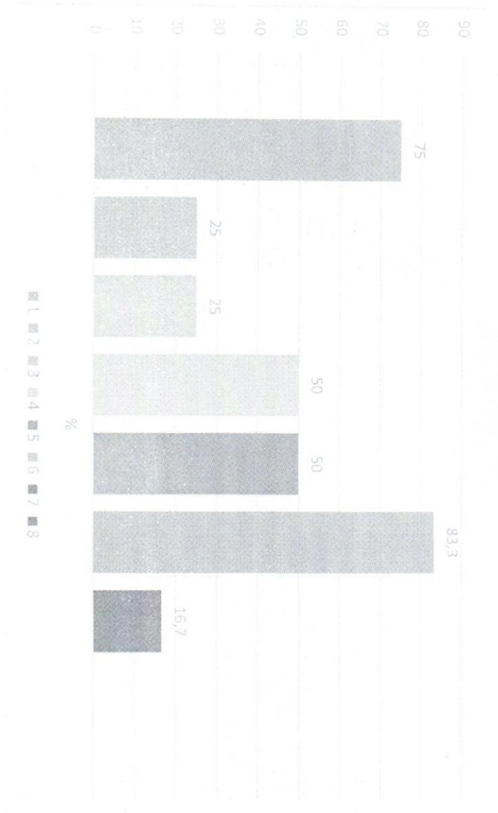
Размещение информации на сайтах каждой ОО БМР ЛО:

Таким образом, информация на сайтах ОО БМР ЛО размещена на 39,5%. В наиболее полном объеме представлена общая информация о том, что такое ВПР и общий график проведения ВПР в БМР ЛО. На сайтах ОО нет ссылок на официальные источники информации о ВПР различного уровня, многие ОО дублируют на своих сайтах распоряжения/письма вышестоящих организаций, часто заменяя ими свои нормативно-локальные акты.