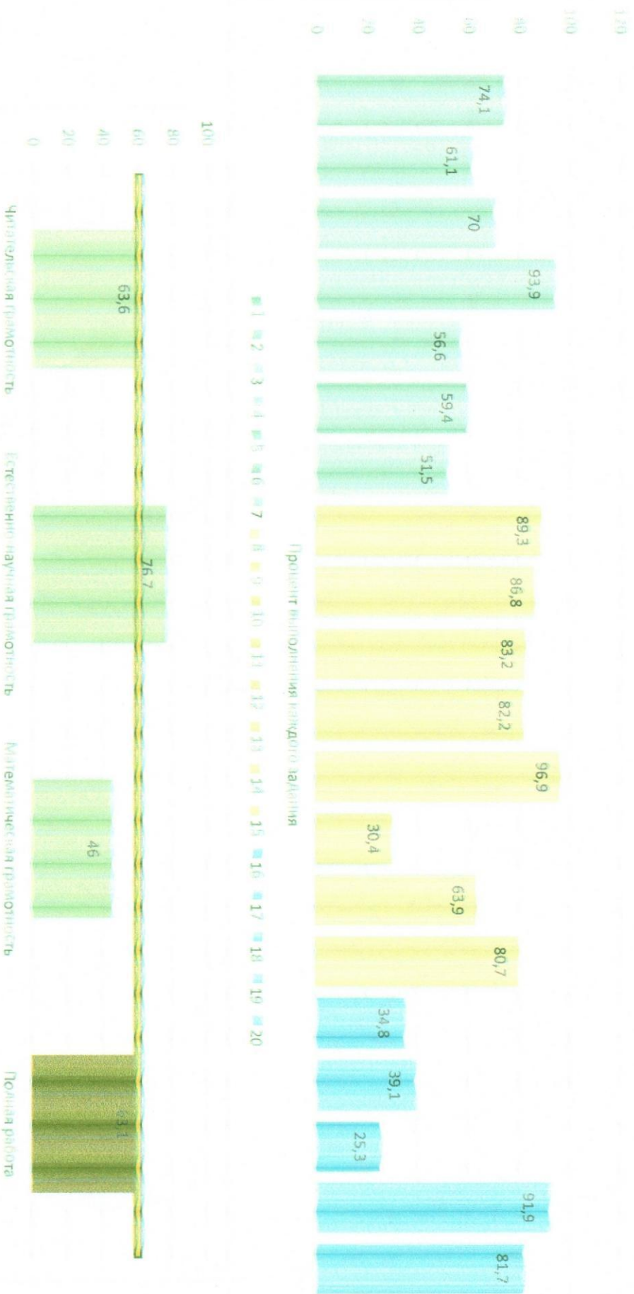
Процент выполнения каждого задания