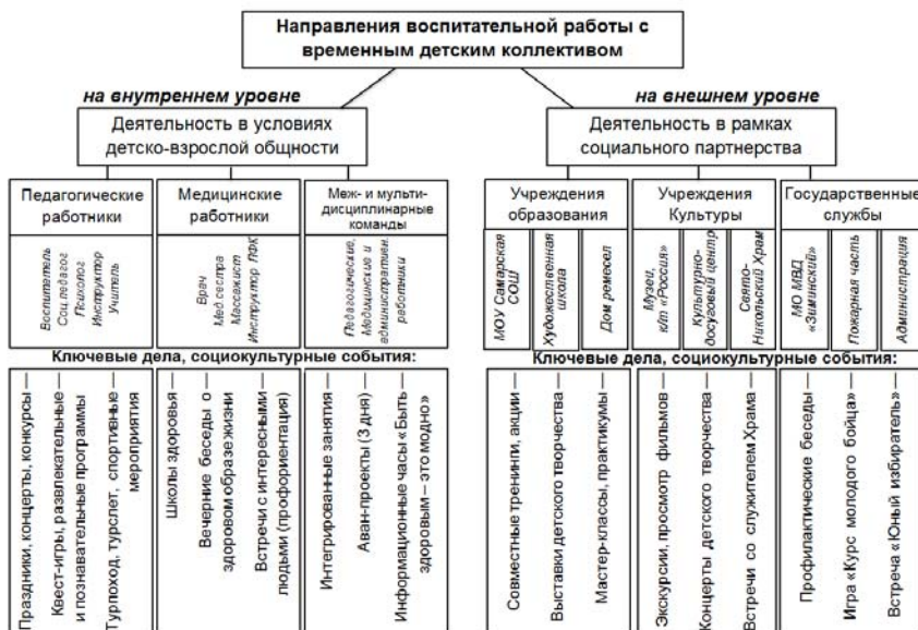
Рис. Внутренние и внешние субъекты взаимодействия

В основе организации воспитательного процесса в РЦ «Сосновая горка» лежит Программа воспитания, в соответствии с которой педагоги учреждения планируют свою воспитательную работу с детьми, включающую в себя разнообразные культурно-досуговые мероприятия и социокультурные события, проводимые как на внутреннем, так и на внешнем уровне (рис.).