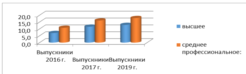
Рис. 1. Уровень безработицы выпускников 2016-2019 гг. образовательных организаций высшего и среднего профессионального образования (по данным выборочного обследования рабочей силы в 2020 году, в %)

Выполнив сравнительный анализ условий, создаваемых в СССР в рамках государственной молодежной политики и в современной России, можно сделать вывод о более защищенном в социальном, профессиональном и личностном аспекте специалисте в СССР, чем молодом специалисте современной России. Об этом говорят данные, приводимые Росстатом: уровень безработицы среди выпускников учреждений высшего и среднего профессионального образования в городе за 2016–2020 годы составил 12,9 и 17,9 % соответственно с тревожной прогрессивной тенденцией [3, 2021], тогда как в СССР проводимая государственная молодежная политика позволила ликвидировать безработицу полностью (рис.1).