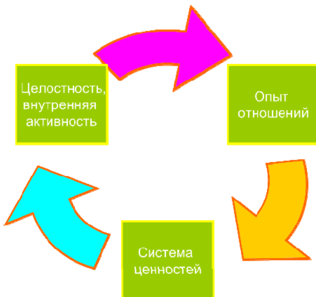
Рис. 1. Схема формирования отношений участников образовательных отношений

ление видов деятельности, определенных программой развития школы, учебным планом, планом внеурочной деятельности. При этом каждый из субъектов достигает состояния внутренней активности в одном из интересных для него видов деятельности (рис. 1). В результате формируется опыт отношений у всех субъектов социального партнерства.