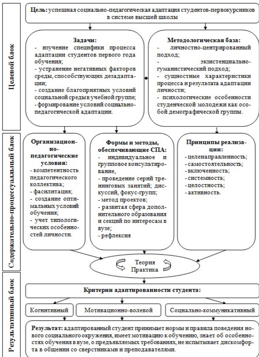
Рис. 1. Моделирование процесса социально-педагогической адаптации студентов первого года обучения высших учебных заведений