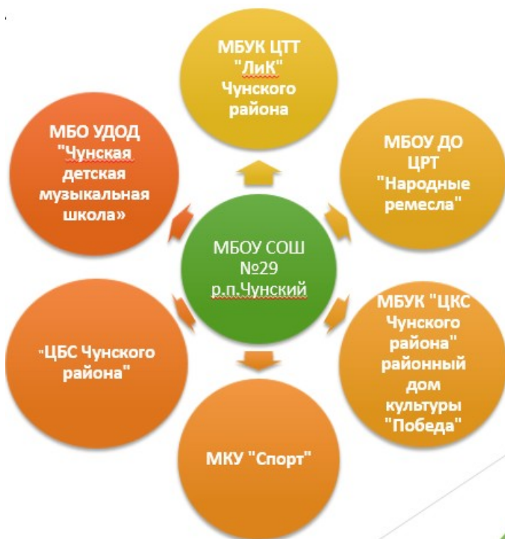
Рис. 2. Схема социального партнёрства МБОУ СОШ № 29 р. п. Чунский с учреждениями района

Отношения, складывающиеся внутри класса, школы, семей учеников, также способствуют возникновению связей с другими учреждениями района. На рис. 2 представлена модель связей школы с социальной средой района. Были проведены следующие совместные мероприятия: