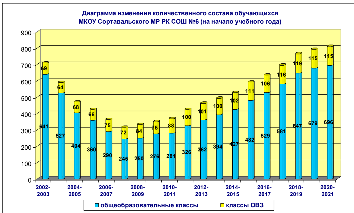
Диаграмма изменения количественного состава обучающихся:

За последние годы рост обучающихся идёт за счет открытия параллельных классов в начальной школе. Общий количественный состав обучающихся с ограниченными возможностями здоровья составляет 137 человек, это 16,9% от общего количества обучающихся.