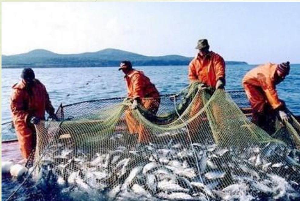
Ловит рыбак судака и треску,