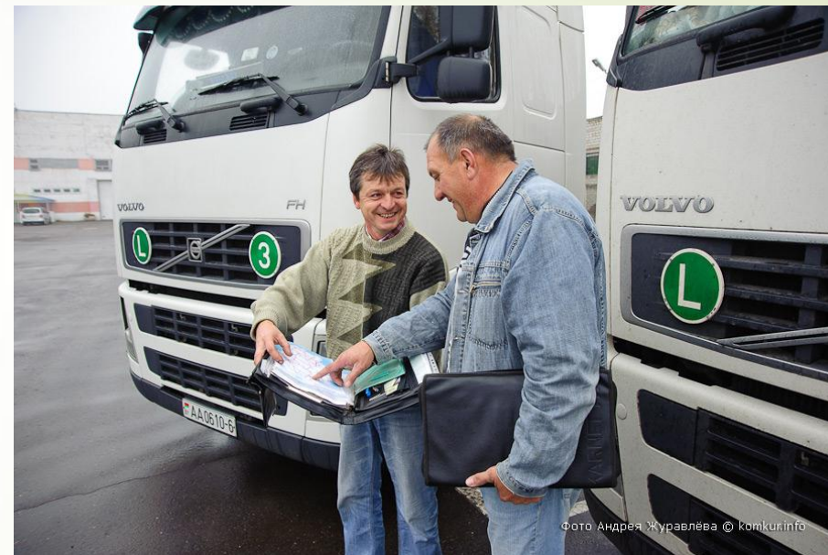
Груз на машине привозит водитель.