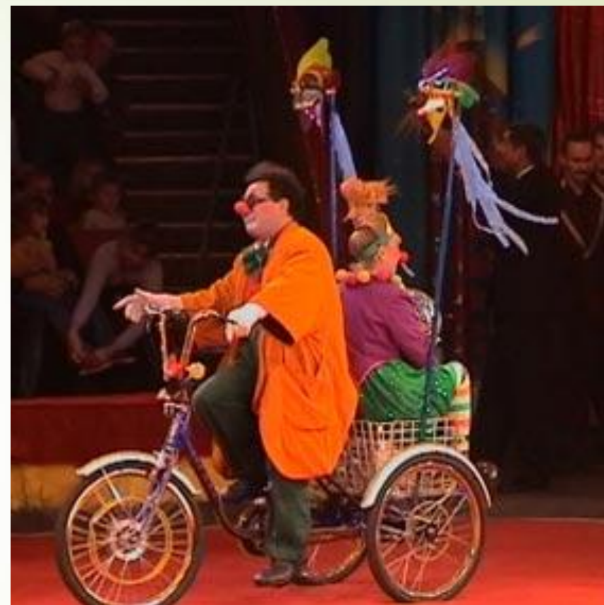
Клоуны в цирке разгонят тоску.