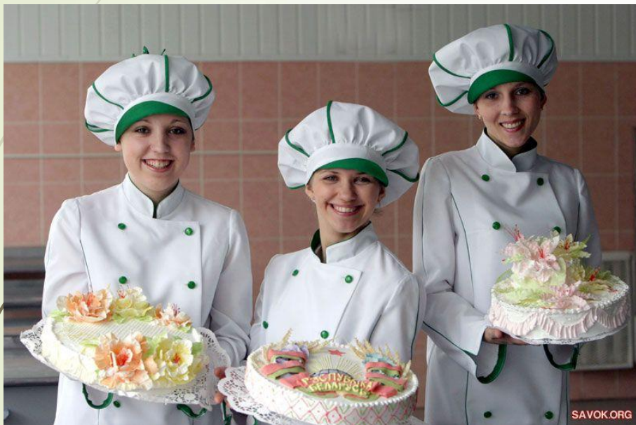
Стряпает торты и кексы кондитер,