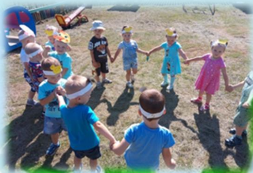
Развлечение «Мы цыплятки дружные»