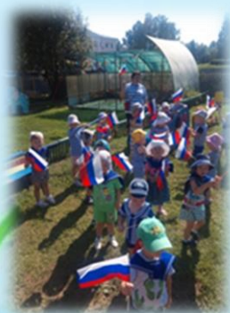
Развлечение «День морячков»

Лето - это благоприятный период для оздоровления дошкольников. Можно больше находиться на свежем воздухе, играть, закаляться и наслаждаться: солнечными лучами и теплой нежной водой. В этом году мной проводилась летняя оздоровительная работа в группе раннего возраста. Создавались условия, обеспечивающие охрану жизни и здоровья детей, предупреждение заболеваемости и травматизма; реализовывалась система мероприятий, направленных на оздоровление и физическое развитие детей, их нравственное воспитание, развитие любознательности и познавательной активности, формирование культурно – гигиенических навыков. В группе был разработан режим дня, согласно летнему периоду: утренний приём на воздухе, прогулки не менее 4 часов, закаливающие мероприятия: солнечные ванны, обливание ног перед сном, обливание рук до локтя, увеличение времени сна, витаминизация и калорийность питания, физкультурные и различные познавательные мероприятия.