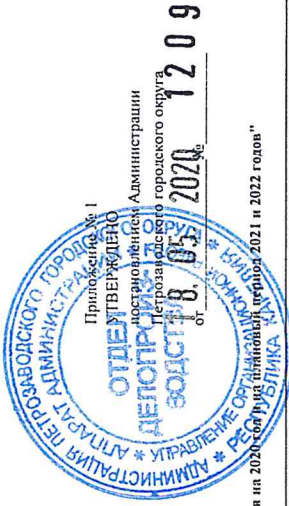
Базовые нормативы затрат на оказание муниципальной услуги "Реализация основных общеобразовательных программ дошкольных образовательных программ дошкольного образования на 2021 год" на 2021 и 2022 годов" руб.