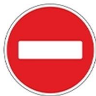
Знак 3.1 «Въезд запрещен»