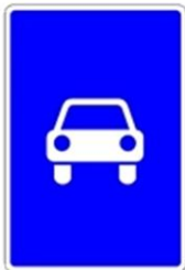
5.3 «Дорога для автомобилей»