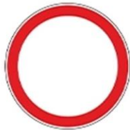
Знак 3.2 «Движение запрещено»