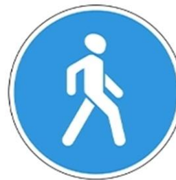
Знак 4.5.1 «Пешеходная дорожка»