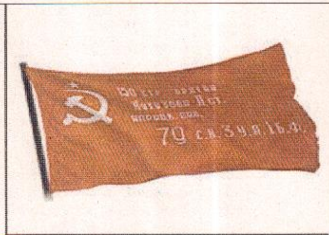
2. Подсказка: оно было водружено на Рейхстагом.