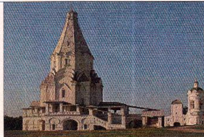
4. Подсказка: название села, в котором был возведена данная церковь.