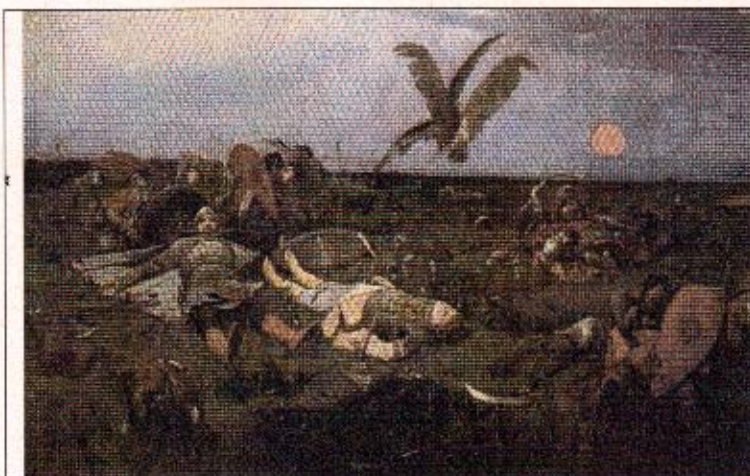
1. Подсказка: противники Игоря Святославовича.

Задание 4. Вам предлагается небольшой зрительный ряд, где в каждом изображении зашифровано одно слово. Для правильной расшифровки под изображениями даны подсказки. Если Вы верно определите все слова, то далее вам не составит труда из первых букв каждого из них сложить ключевое слово-понятие. Впишите название каждого слова, скрытого за изображением в таблицу, составьте ключевое слово (учтите, что в первые буквы в таблице будут расположены не по порядку) и внесите его в ответ, дайте определение ключевому слову-понятию (максимальное количество баллов - 10).