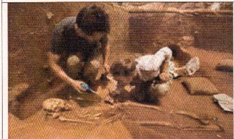
3. Подсказка: историческая наука.