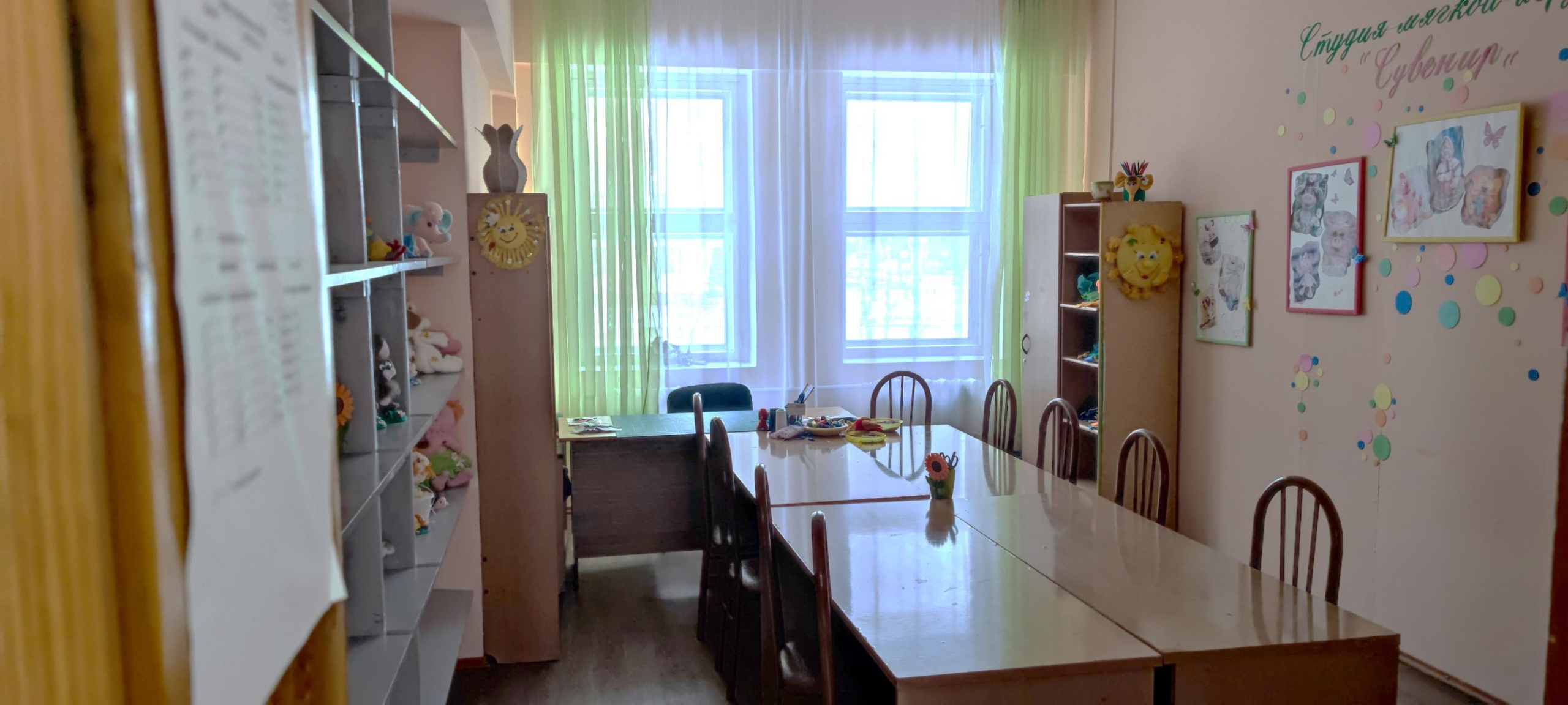
Кабинеты для занятий студий