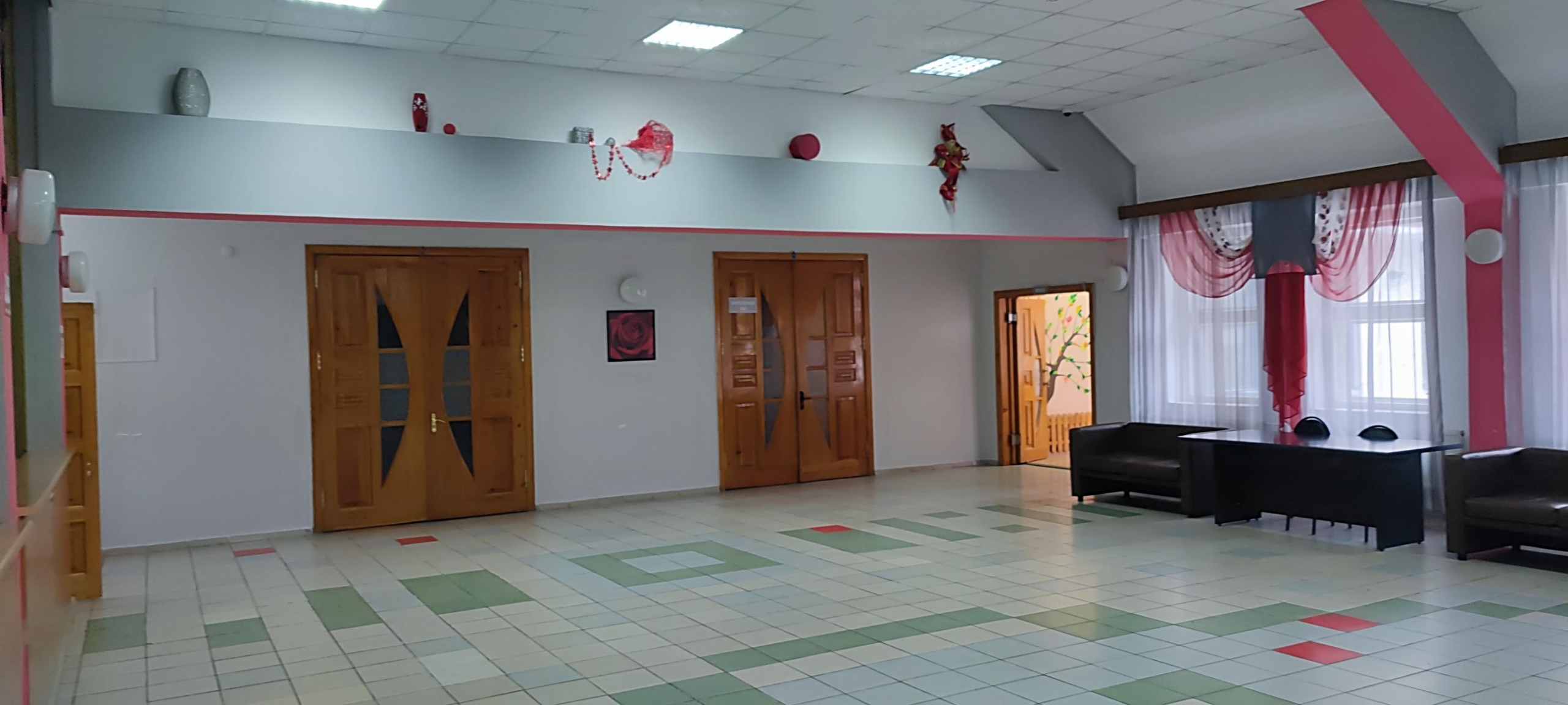
Фойе культурно-развлекательного центра