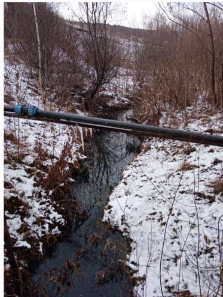
Современный вид водопровода у родника