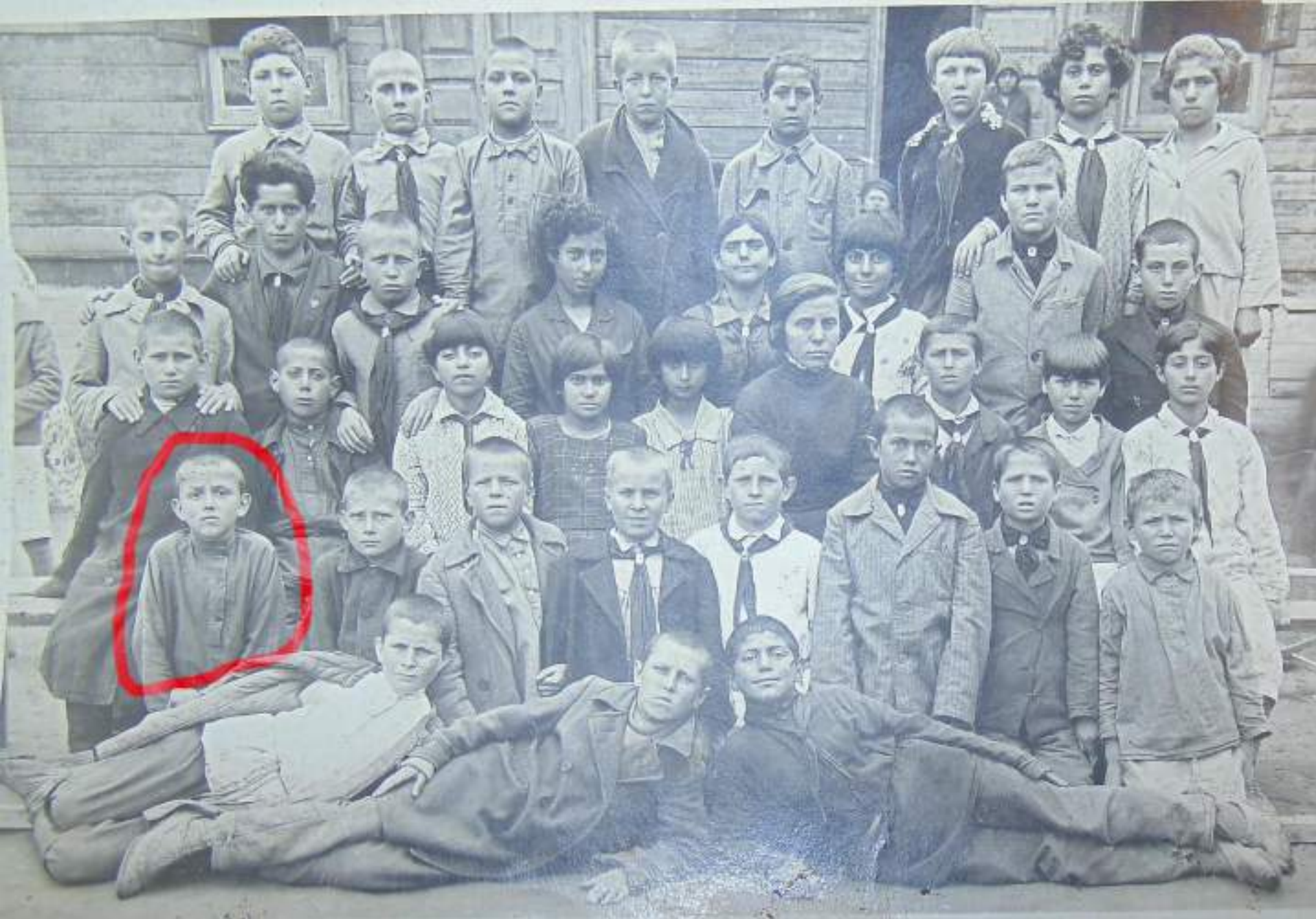
Родился в Ростове-на-Дону, проживал в Нальчике.