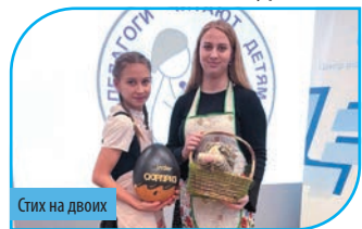
Стих на двоих

Главная цель этого конкурса — знакомить детей с поэзией Карелии.