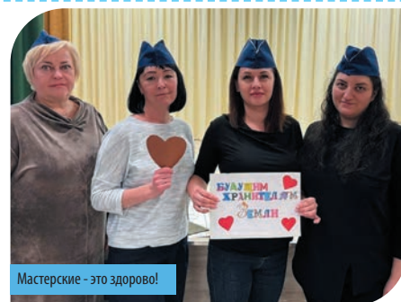
Мастерские - это здорово!

и побывала с ней». В ходе клубной игры «Солнечные дети и родители» мы узнали друг друга с новых, порой неожиданных сторон. А кульминацией стала искренняя дискуссия на тему «Личностные кризисы ребёнка: как не потерять доверие». Это был честный, важный разговор, задавший вектор всей нашей дальнейшей работе.