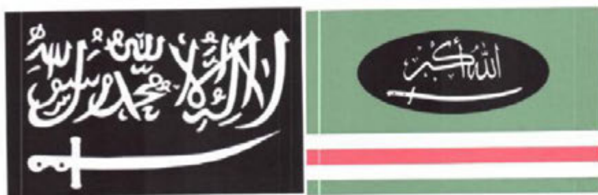
Рисунок 14. Символика вилайятов (административно-территориальных образований) организации «Кавказский эмират» («Имарат Кавказ»).

Отсутствие осознания общественной опасности террористических проявлений подростком может выражаться в наличии в публикациях на его странице или странице его друзей, а также страницах сообществ (групп), в которых он состоит (на которые подписан), информационных материалов, оправдывающих совершение преступлений экстремистской и террористической направленности, в том числе на территории зданий органов государственной власти и местного самоуправления.