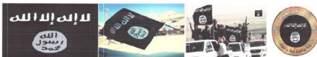
Рисунок 12. Символика организации «Исламское государство».