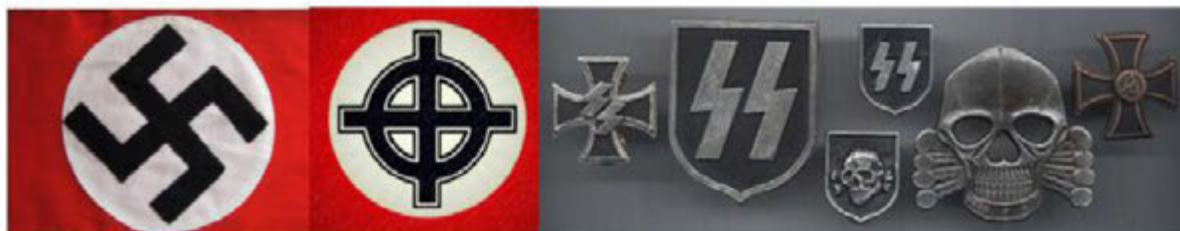
Рисунок 10. Нацистская атрибутика и символика.

Атрибутики, символики запрещенных в Российской Федерации экстремистских и террористических организаций: