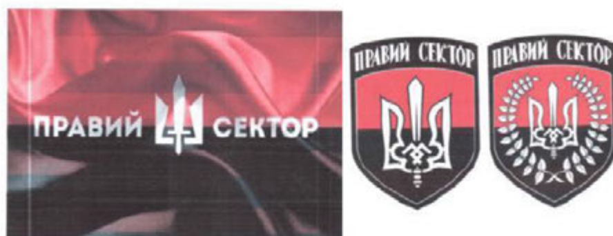
Рисунок 11. Атрибутика организации «Правый сектор».