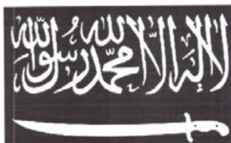
Рисунок 13. Символика организации «Кавказский эмират» («Имарат Кавказ»).