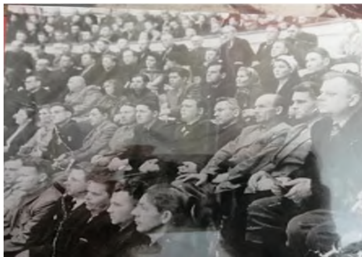
Большекрепинская делегация на 2 Всесоюзном съезде колхозников.