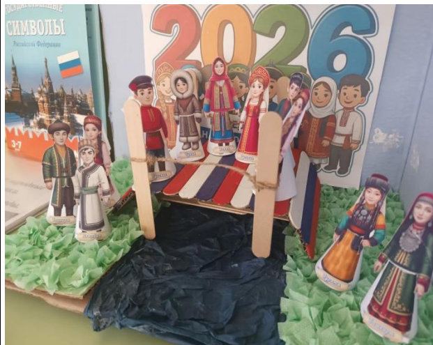
Проект воспитательной направленности