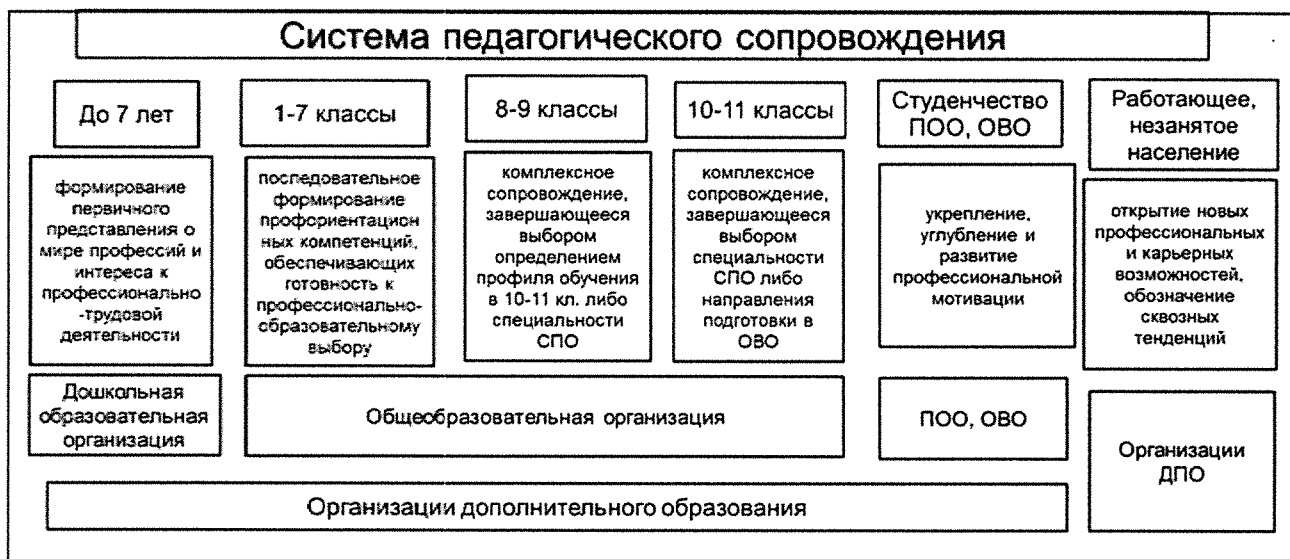
Рисунок 1. Модель педагогического сопровождения профессионального самоопределения обучающихся

В качестве конкретизированных объектов модели педагогического сопровождения профессионального самоопределения обучающихся выделены основные возрастные образовательные группы, с которыми возможна работа по психолого-педагогическому сопровождению профессионального самоопределения (рис. 1).