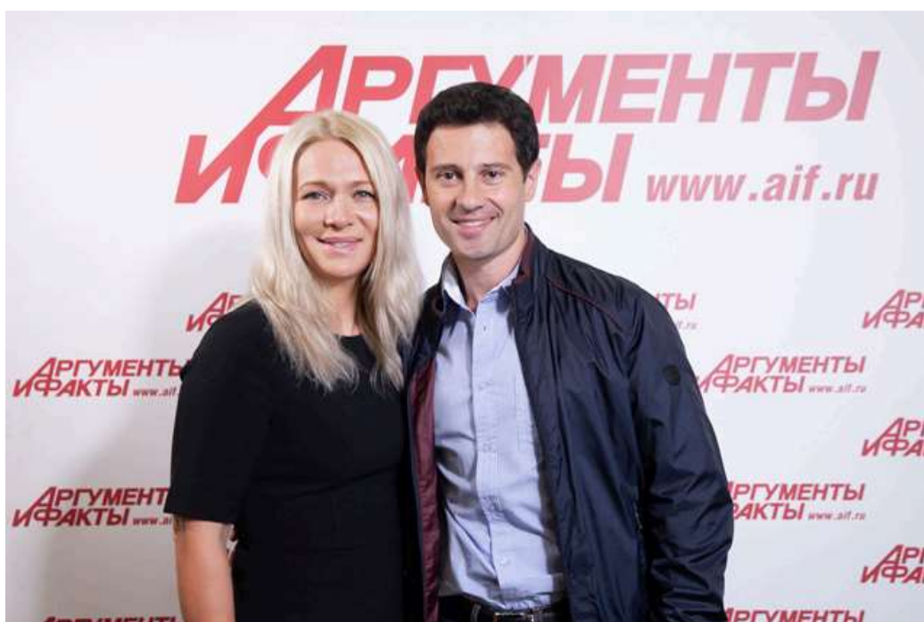
Макарский Антон Александрович, актёр театра и кино, и Макарская Виктория Николаевна, певица, продюсер.

Посаде, куда из Москвы перебралась семья Макарских — Ред.): "Конечно, можно. Не жизнь для школы, а школа для жизни. Ваша дочь съездит вместе со своей семьей в Грузию, а потом всем расскажет, как это было замечательно"».