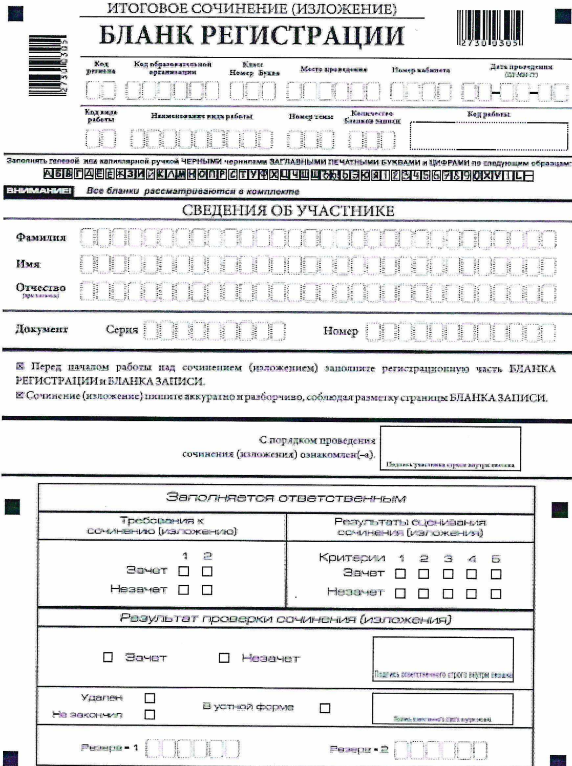
Рис. 1. Бланк регистрации

В верхней части бланка регистрации (рис. 2) расположены: