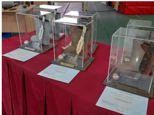
Призы для награждения