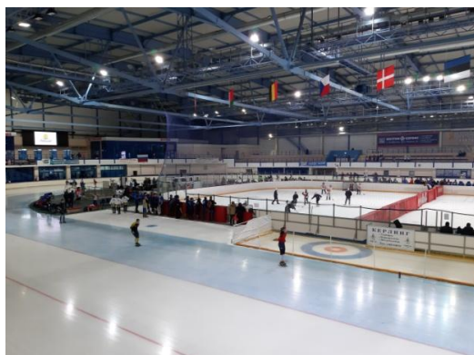
Ледовый дворец «Уральская молния»

Благодарим женскую команду «Занесенный мелом» СОШ №21 за участие в Фестивале «Профсоюзы на льду»