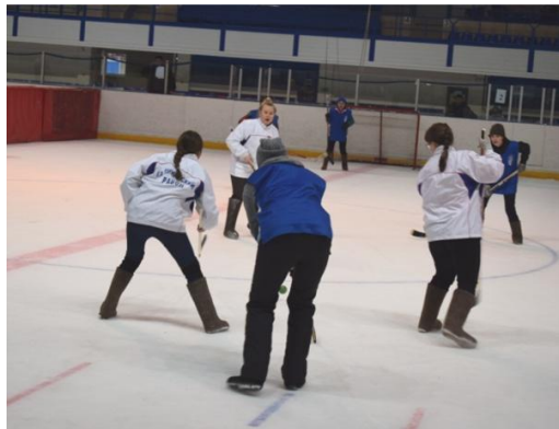
Женская команда «Занесенные мелом» СОШ №21