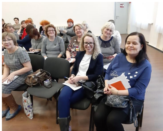
Делегаты Пленума (Комитета) РК Профсоюза