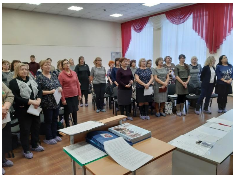
Звучит Гимн Профсоюза работников образования