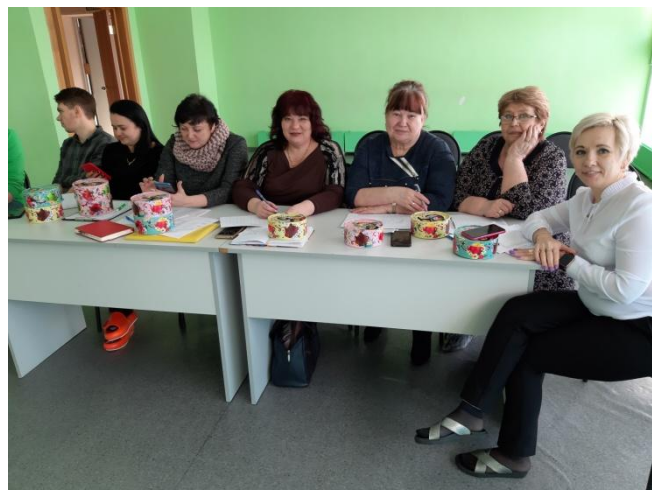
Члены жюри команд КВН