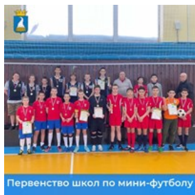
Первенство школ по мини-футболу

С 15 по 17 января 2024 года состоялось Первенство школ КМО по мини-футболу среди юношей среднего возраста в зачет Спартакиады. Команда нашей шко-