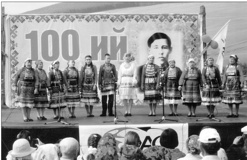
Спєньшгє — «Ондриял» ансамбль.

лан возен колтымo кугу серышыжым савыктен. «Кучедалме тулеш» (1958) ден «Чолпан Иван» (1966) роман-влак посна книга дене лектыныт. 1972 ийыште шочшо «Фронтвик-влак» сборникыш тыгаяк лўман повесть, «У вий сенгыш» ден «Корно ўмбалне» ойлымаш-влак да Сергей Чавайн нерген «Юбилей» очерк пурталтыныт.