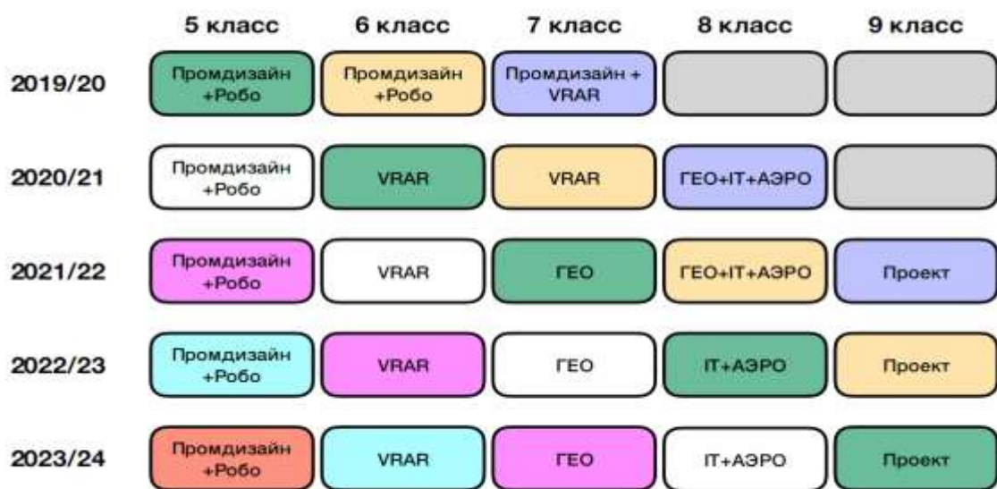
Рис. 1. Траектория ввода образовательных программ