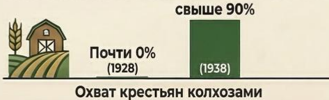
Охват крестьян колхозами