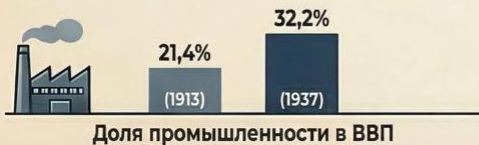
Доля промышленности в ВВП