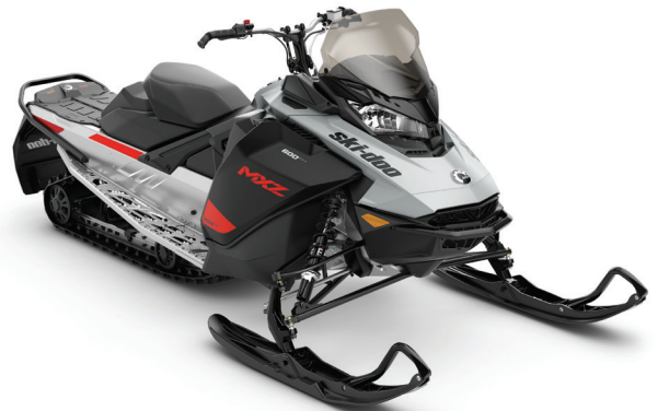
MXZ ® SPORT