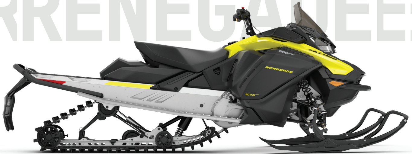
RENEGADE® SPORT 600 ACE™