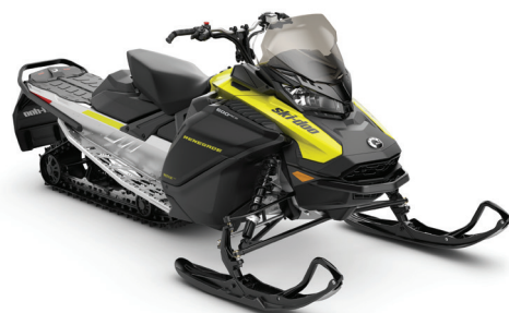
RENEGADE® SPORT 600 ACE™