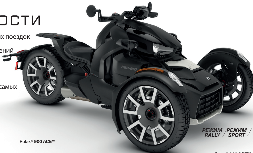
Rotax® 900 ACE™