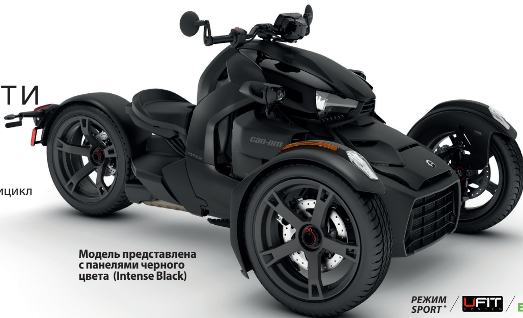
Модель представлена с панелями черного цвета (Intense Black)