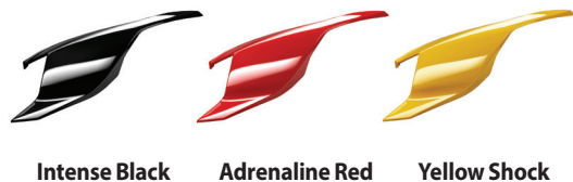
Intense Black Adrenaline Red Yellow Shock