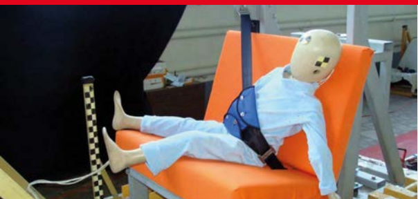
Результаты тестов использования небезопасных удерживающих устройств*

Дополнение определения «направляющая ляжка» в Правилах ЕЭК ООН № 44-04 было одобрено Всемирным Форумом (WP.29). Внесенная поправка к формулировке указывает на то, что «направляющая ляжка» рассматривается как составной элемент детской удерживающей системы и НЕ может отдельно официально утверждаться в качестве детской удерживающей системы в соответствии с настоящими Правилами». Это исключает даже формальную возможность сертификации устройств типа «направляющая ляжка»!