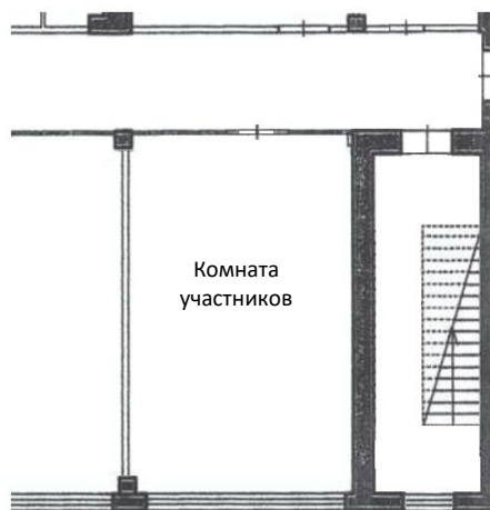
Схема кабинки участника

Корпус 2 лабораторный корпус 2 этаж (ул. Советская, 11)