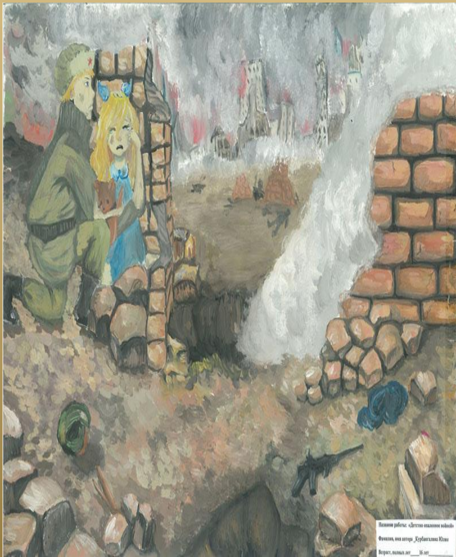
Пейзаж работы: «Детство в окопах войны» Фамилия, имя автора: Курбангалова Юлия Возраст, полных лет: 16 лет