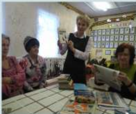
Историко-литературный час «900 дней славы и бессмертия», 23.01.2019

На базе музея «Родные истоки» работает краеведческий кружок (10 человек). Основная его деятельность – сбор информации об участниках ВОВ, работа с детьми войны, организация встреч поколений, подготовка мероприятий.