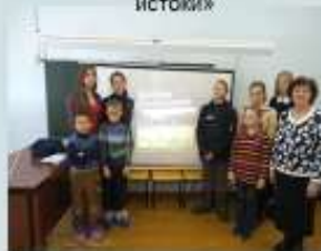
Краеведческий час «Люблю тебя, мой край родной», 26.03.2019