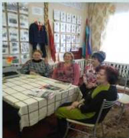
Встреча с детьми войны «Жестокая правда войны», 29.04.2019