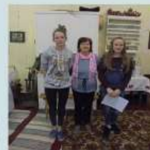
Карельская горница. Защита исследовательской работы «Нам не забыть родное имя», 26.03.2019

На протяжении последних лет ГТРК неоднократно готовило сюжеты о нашем музее: