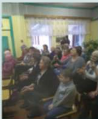
Праздничное мероприятие «Образ бережно храним»

Различные беседы, многочисленные встречи, конференции, экскурсии, благоустройство мест воинских захоронений и Мемориалов Славы, возложение венков 23 февраля, 22 июня и 9 мая, акции Вахта памяти и Бессмертный полк, ежегодные концерты, посвященные Дню Победы и др.