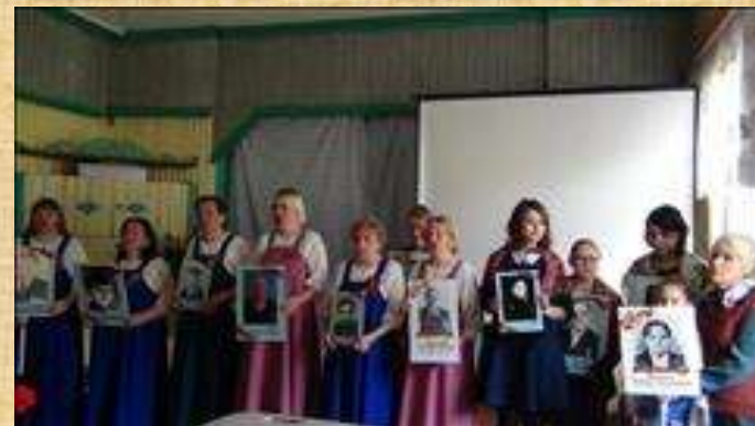
для детей и молодежи