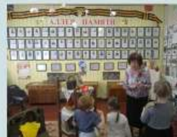
Патриотический час «Нам нужен мир», 29.04.2019