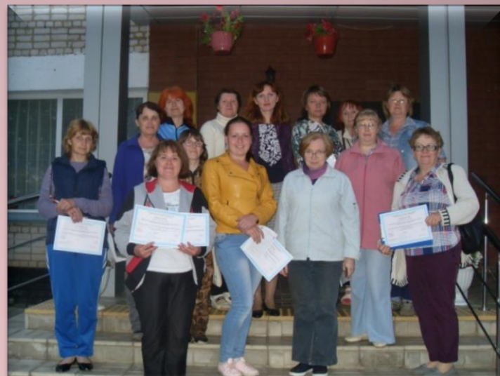
Летняя экологическая школа г. Западная Двина (2017)