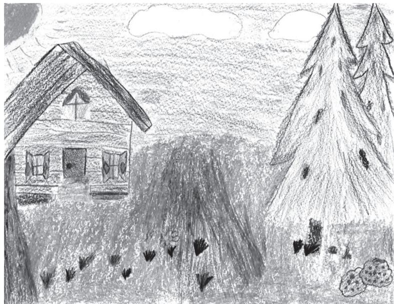
Дудышева Анастасия ученица 5 класса