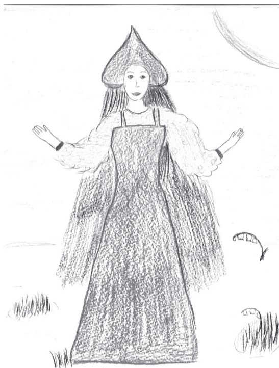
Неясов Антон ученик 5 класса

Весна! На улице весна! И птицы песни запевают. Идет красавица весна, И людям радость посылает.