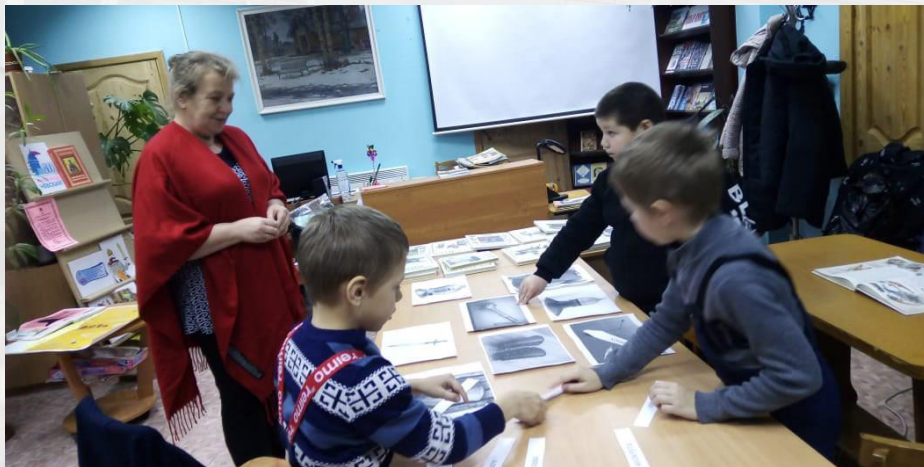
800-летие Александра Невского