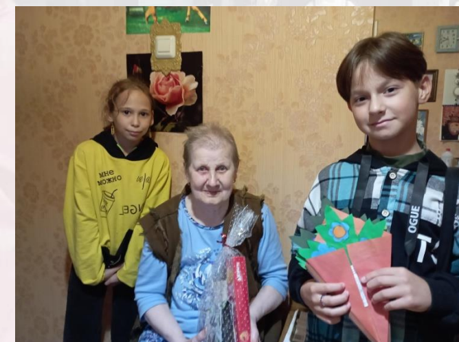
«День пожилого человека»