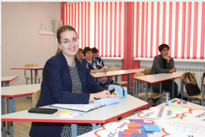
Муниципальный учебно-методический семинар