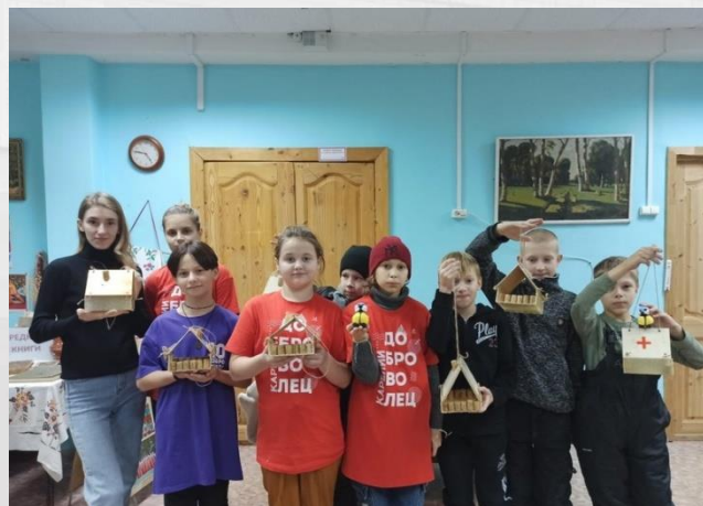
«Покормите птиц зимой»