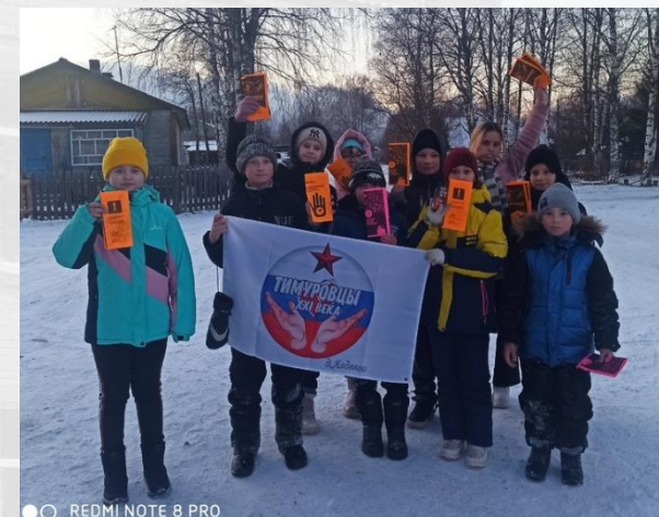
«Нет» вредным привычкам