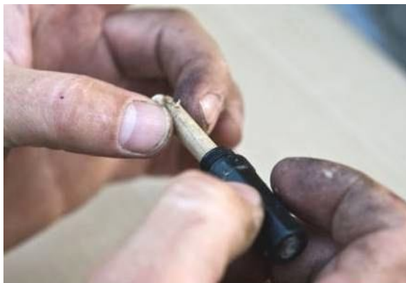
Солдатский медальон в руках поисковика