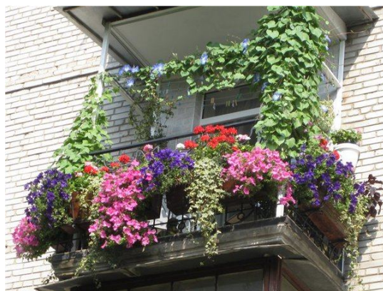
Таким красивым может стать ваш балкон

Приглашаем вас принять участие в конкурсе!